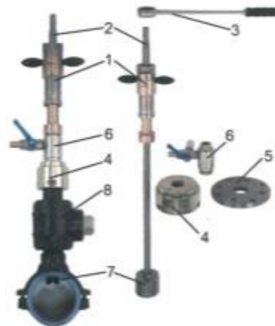
4. sz. ábra

A készülék nyomás alatti PE anyagú gázelosztó vezeték megfúrására max. 10 bar üzemi nyomásig alkalmazható!