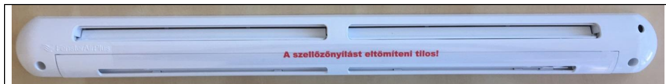
FENSTER AIR Plus Hygro 02