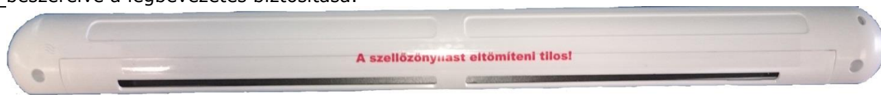
FENSTER AIR Plus S01

Alkalmazás: A termék felhasználási területe az épület szellőzése céljából a nyílászáróba beszerelve a légbevezetés biztosítása.