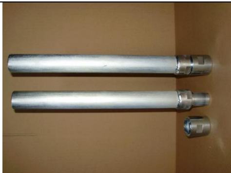
PE-acél hegeszthető összekötő