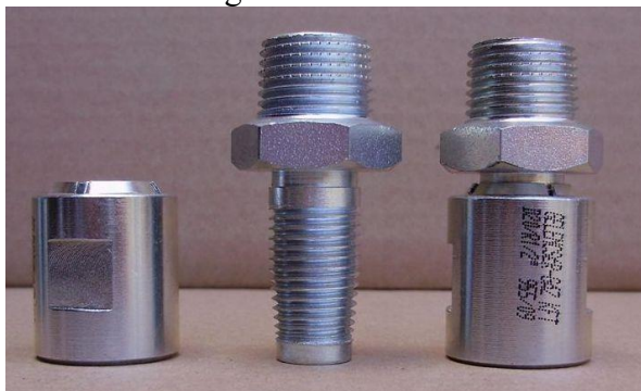
PE-acél menetes összekötő